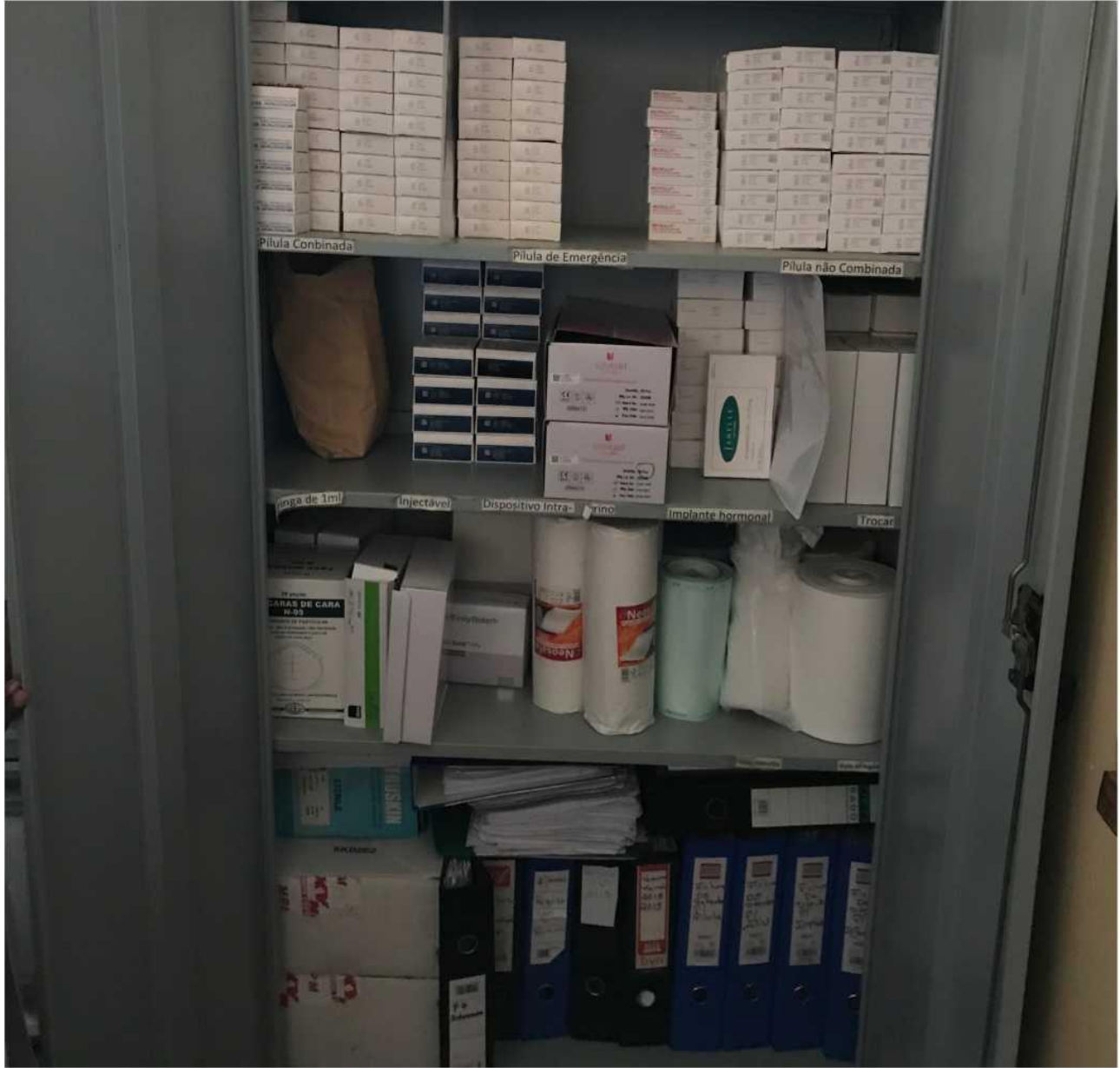
إمدادات ووسائل منع الحمل في مركز صحي بموزمبيق.