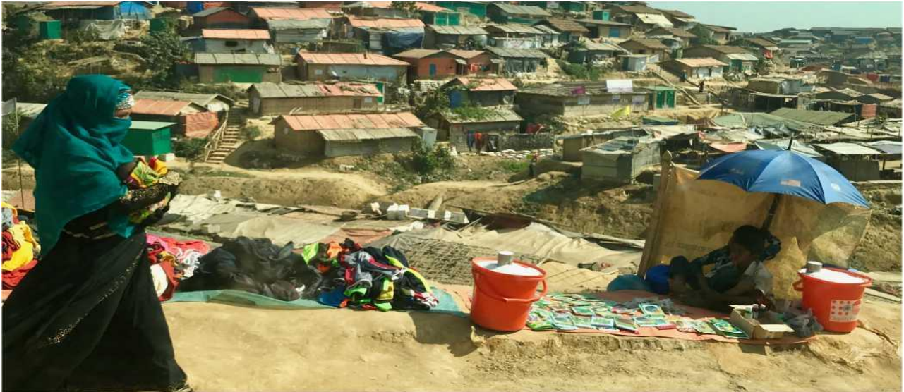
مخيم كوتوبالونغ، كوكس بازار، بنغلاديش.