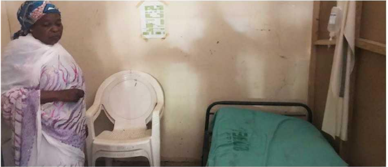
رئيس قسم تنظيم الأسرة في غرفة الفحص في العيادة في موجكوليس، ولاية بورنو، نيجيريا.