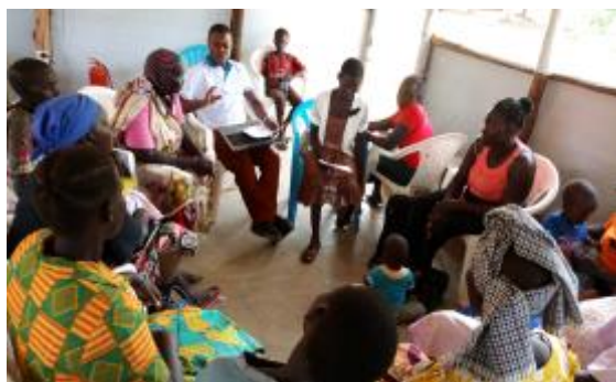
Réunion de consultation avec les femmes réfugiées handicapées dans le camp de Bididi en Ouganda

Risques, obstacles et stratégies relatifs à la VBG identifiés: Les trois projets ont permis de mener des consultations communautaires avec différents groupes d'âge et de sexe des personnes handicapées afin d'identifier les risques, les obstacles et les stratégies liés à la VBG afin de renforcer leur inclusion (actions 1.1 et 1.3).