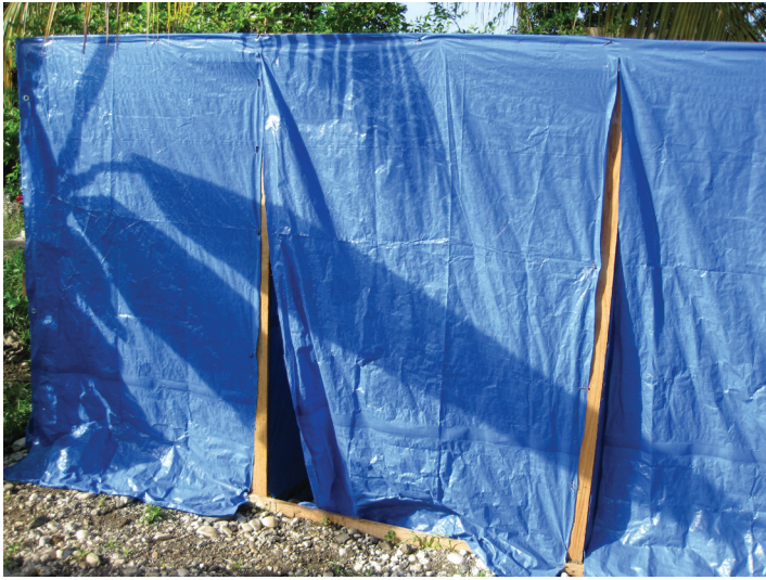
Lokal pou benyen ki pa gen ni pòt klele, ni limyè, ni separasyon ant gason ak fi, Leyogàn.