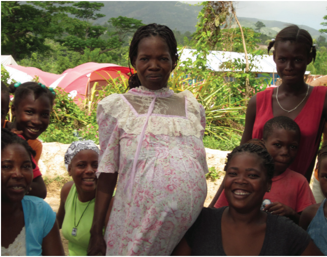
Fanm ansent sa a, ki nan enstalasyon pou deplase Mont Fluery andeyò Jakmèl, ap bezwen mache 45 minit pou rive nan wout ki pi prè a pou jwenn transpò pou al lopital lè l pral akouche.

deplase Leyogàn yo te bezwen kapòt pou fi tou. Nan kesyon pran prekosyon jeneral pou evite gaye enfeksyon nan enstalasyon medikal yo, sa ki pi piti yo pa t gen ensineratè e yo te gen difikilte pou elimine deche medikal. Yo pa t rapòte okenn gwo pwoblèm nan kesyon konfòmite ak pwotokòl pou bay transfizyon san ak bon sans e ak tout sekirite.