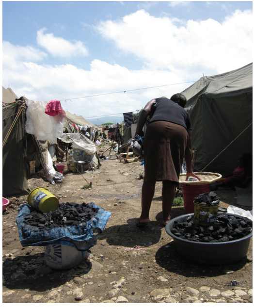
Moun ki pase anba tranblemanntè a ap viv an pèkmèl nan kan Pinchina, Jakmèl.

Lefètke Ayiti te gentan mete pwogram VIH sou pye, yo te kapab kontinye efò prevansyon yo aprè tranblemanntè a. UNFPA a te mande e distribye 7 milyon kapòt pou gason nan zòn tranblemanntè a te touche. Okòmansman, li te sanble kan Pòtoprens yo te gen kapòt toupatou, men kounye a, kominote yo deklare se achte yo dwe achte yo, e li pa fasil jwenn yo nan zòn andeyò Pòtoprens. Nan Jakmèl, kèk fi fè konnen yo pase tès VIH la plizyè fwa pou resevwa senk kapòt. Fanm